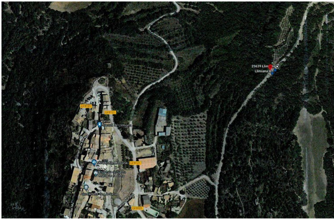
Camí de la Serra