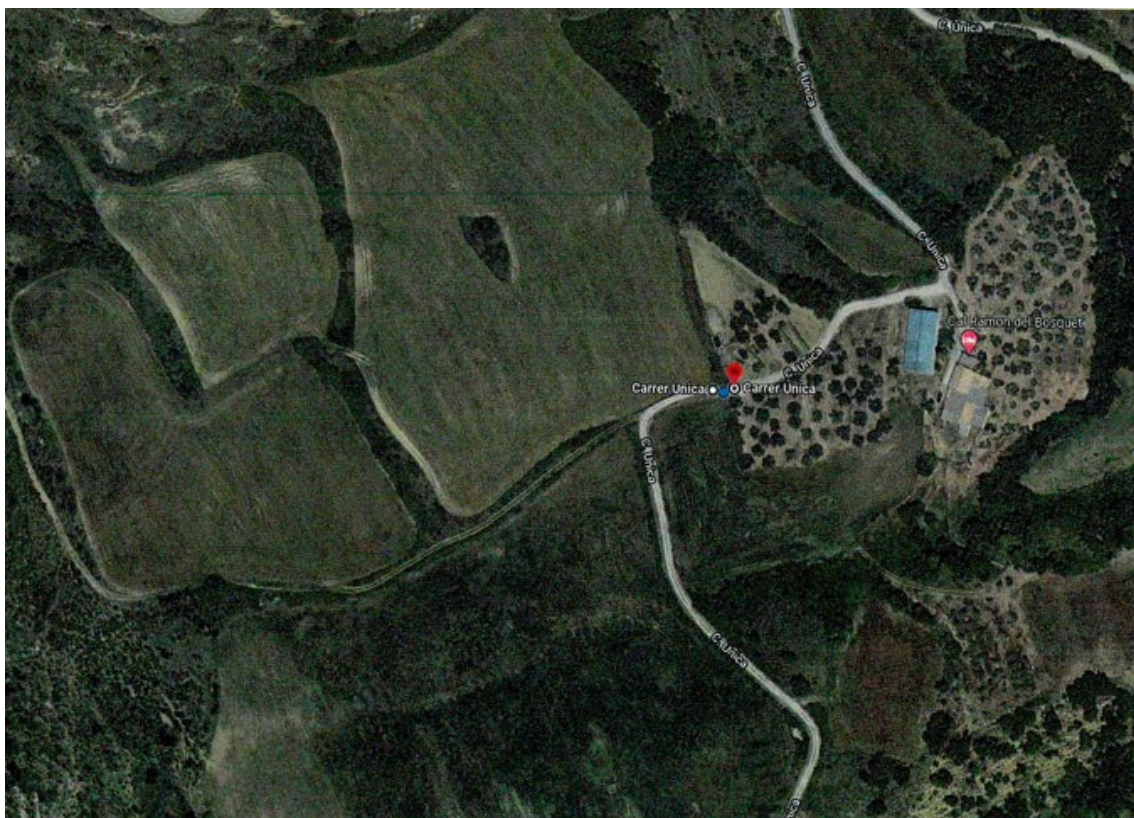
Camí de la Masia de Soriguer